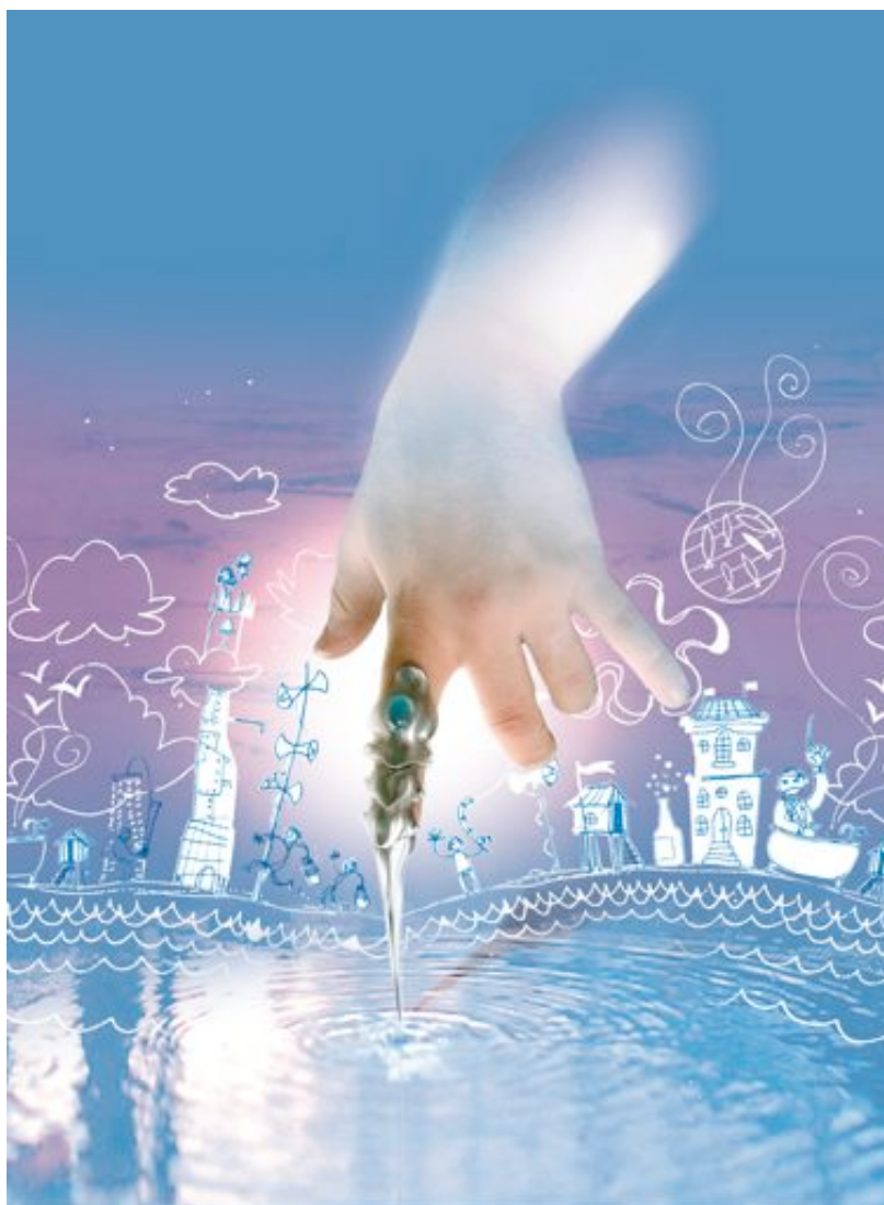
Illustration : Tonitorfer

Spectacle tout public à partir de 7 ans Durée 50 minutes